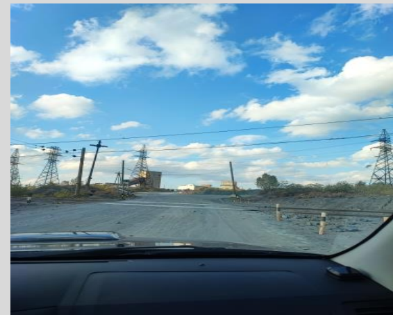
Переезд № 3 h 5,5 м

Опасные пересечения с контактной сетью на ж/д переездах, высотой менее 6 метров.