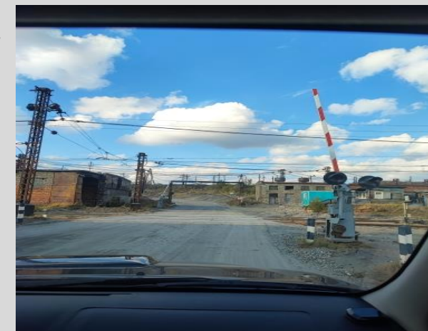
Переезд №2 h 5,5 м