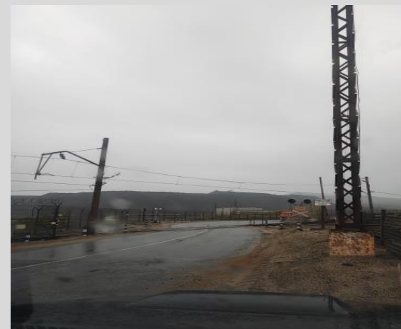
Переезд №1 h 5,5 м