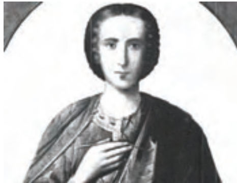
△ Великомученик Пантелеимон

том, что родится у них Дочь, которую благословит весь род человеческий. По повелению Небесного Вестника праведные Иоаким и Анна встретились в Иерусалиме, где у них и родилась Дочь, нареченная Марией.