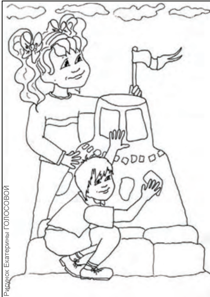
Рисунок Екатерины ГОЛОСОВОЙ

✦ В марокканском городе Марракеш есть одна историческая достопримечательность, которой нигде в мире больше нет. Там на видном месте стоит 67-метровая минарет-башня, с которой мусульман призывают к молитвам. Минарет радует глаз не только своим величием, но и услаждает обоняние характерным запахом мускуса. Благоухает минарет уже восемь столетий, со дня его основания в 1195 году султаном берберской династии Альмохадов Якубэль-Мансуром в честь победы в битве при Аларкосе над Кастилией - средневековым королевством на Пиренейском полуострове. Дело в том, что при строительстве минарета был использован известковый раствор с добавлением большого количества мускуса. Всего использовано около 960 мешков этого благовония.